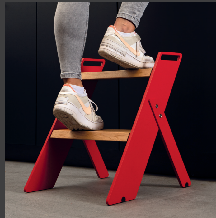
Alpha Step gibt es in allen SONDERFARBEN (gegen Aufpreis)

Alpha Step standard in black with light oak steps