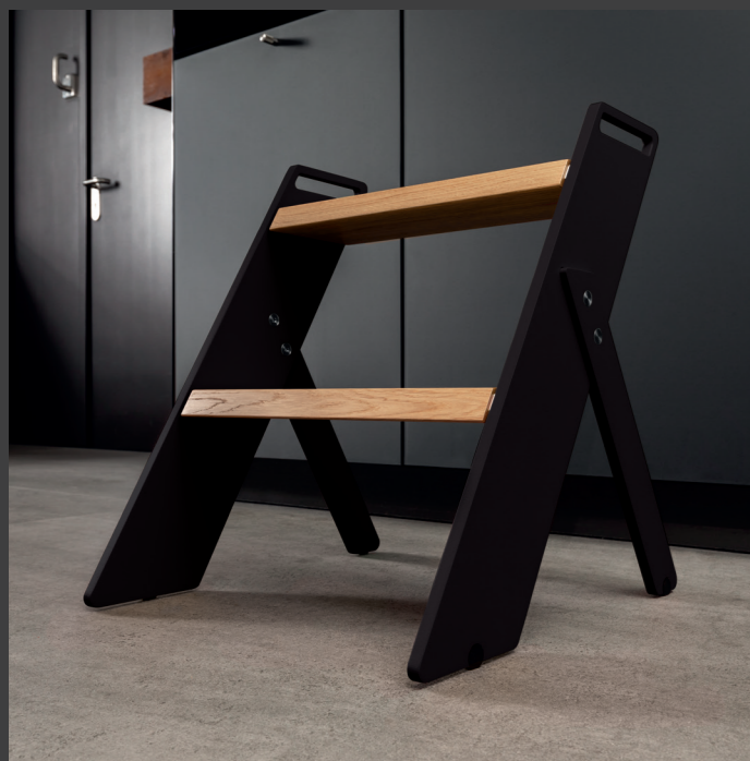
Alpha Step STANDARD in Schwarz mit hellen Eichenstufen

Alpha Step standard in black with light oak steps